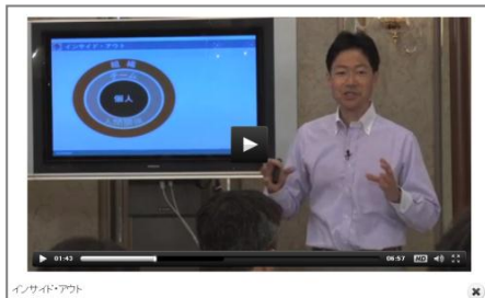
社内ファシリテーター・ウェブ養成コース 講座イメージ画像