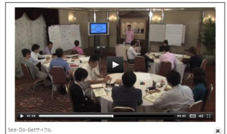
社内ファシリテーター・ウェブ養成コース 講座イメージ画像