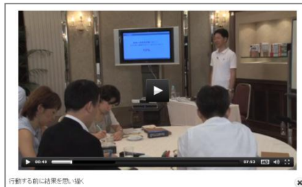
社内ファシリテーター・ウェブ養成コース 講座イメージ画像