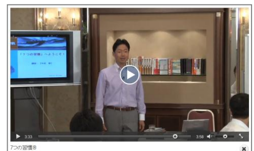
社内ファシリテーター・ウェブ養成コース 講座イメージ画像